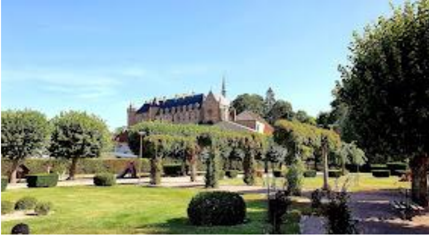
Lapalisse- Parc floral de 3 ha en centre- ville.