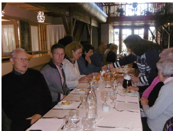
Restaurant Le Tahiti

Le nom de "Maison du Mouton" intrigue et fascine.