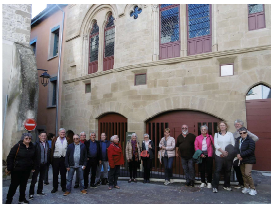
Maison du Mouton Romans