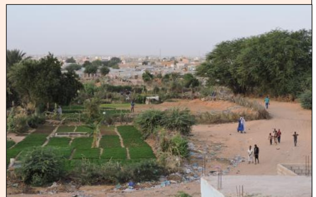
Jardin maraîcher dans Dar Naïm

Les bénéficiaires directs sont les 50 Organisations de la Société Civile (OSC), les 120 jeunes déscolarisés ou en déperdition scolaire, les 104 coopératives (soit près de 1000 femmes). Les bénéficiaires indirectes sont l'ensemble de la population.