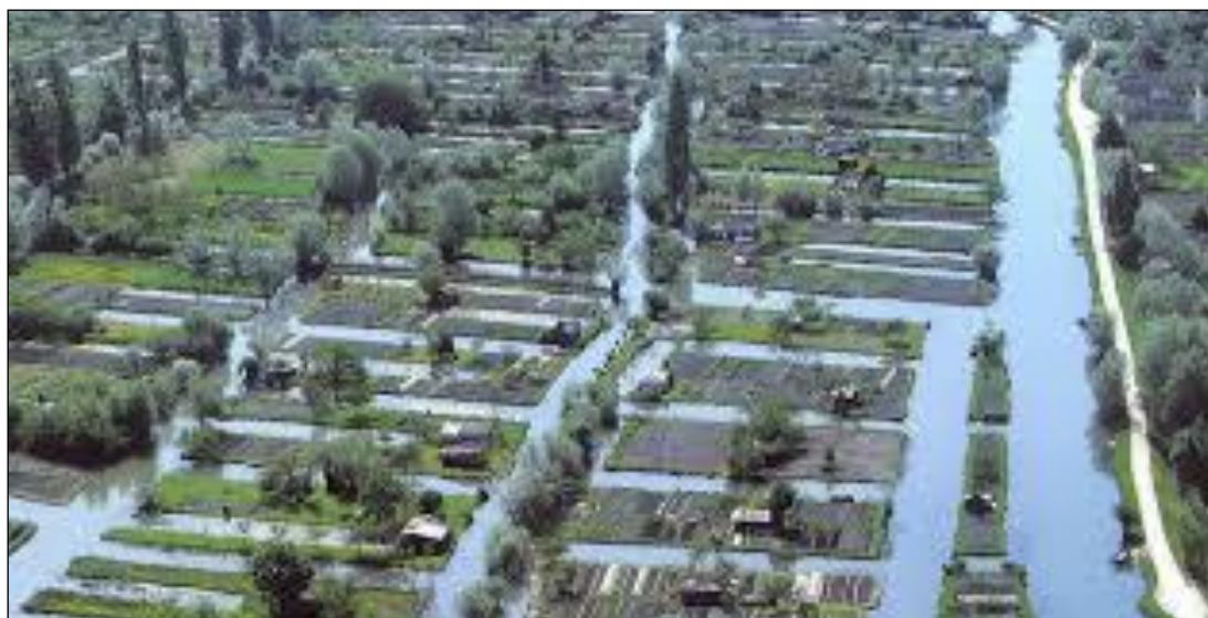
Vue aérienne des marais de Bourges, poumon de la ville.

"voir les 66 propositions du Pacte pour le pouvoir de vivre"